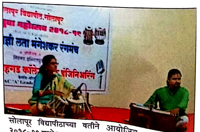
सोलापूर विद्यापीठाच्या वतीने आयोजित युवा महोत्सव २०१८-१९ मध्ये कला सादर करताना महाविद्यालयाचे विद्यार्थी