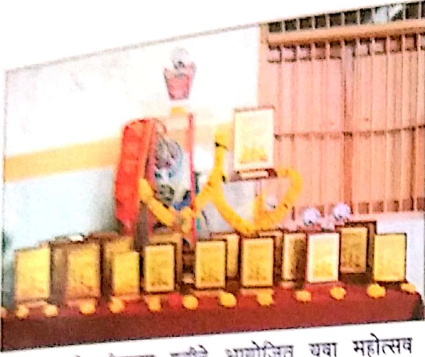
सोलापूर विद्यापीठाच्या वतीने आयोजित युवा महोत्सव २०१८-१९ मध्ये महाविद्यालयास सर्वसाधारण विजेतेपद प्राप्त झाले. त्याची विविध स्तुतीचिन्हे...