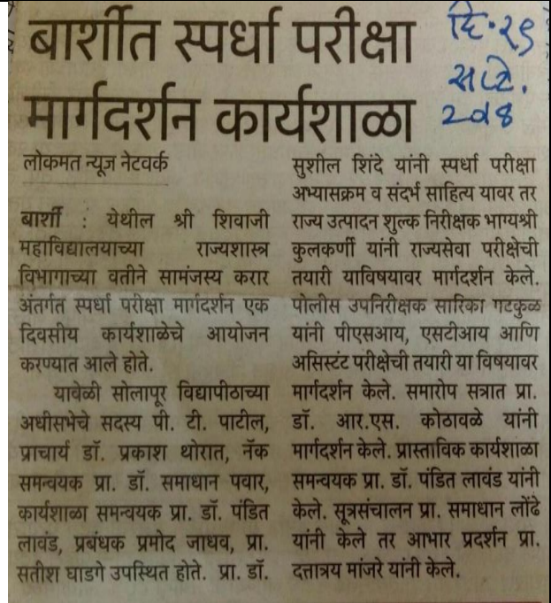
Competitive Examination Guidance News Dated 25 September 2018