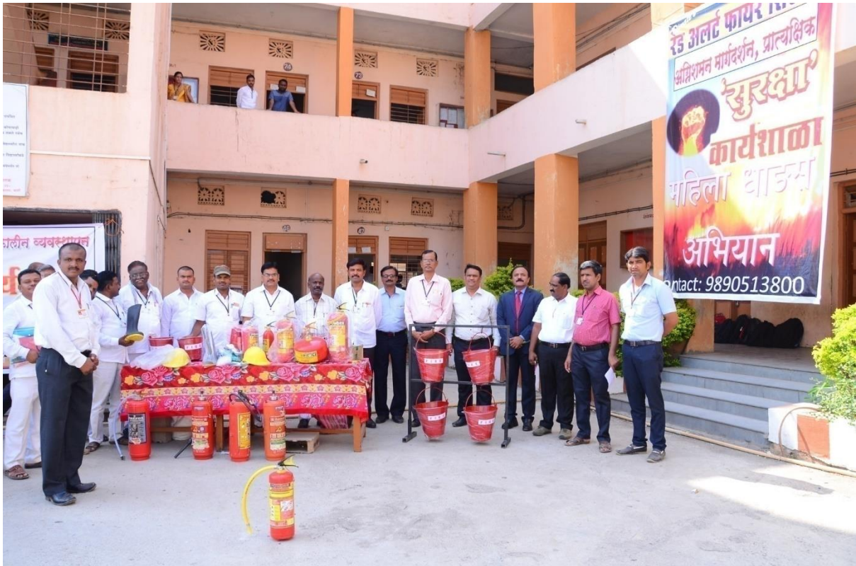
Demonstrations on Disaster Management