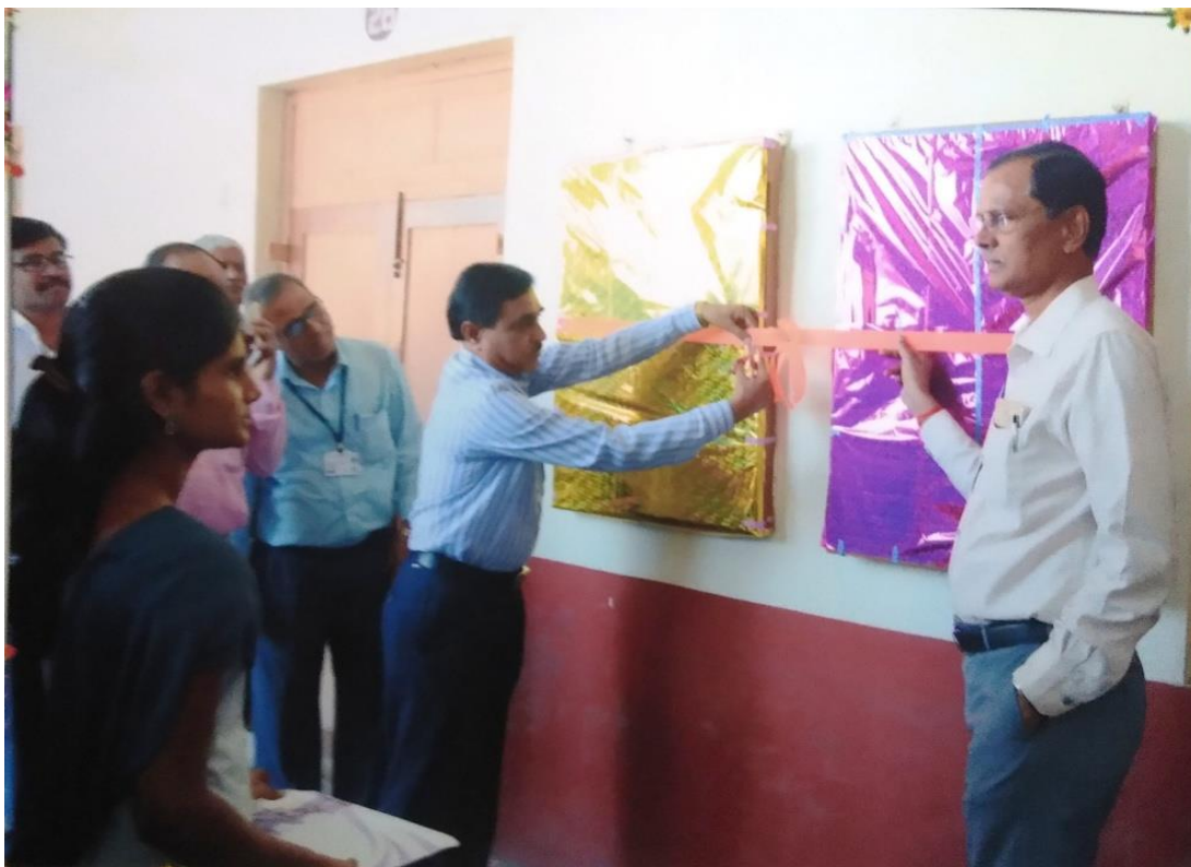
Celebration of Physica festival and opening of wall paper by Dr. M.K. Patil, Nanded, 2018