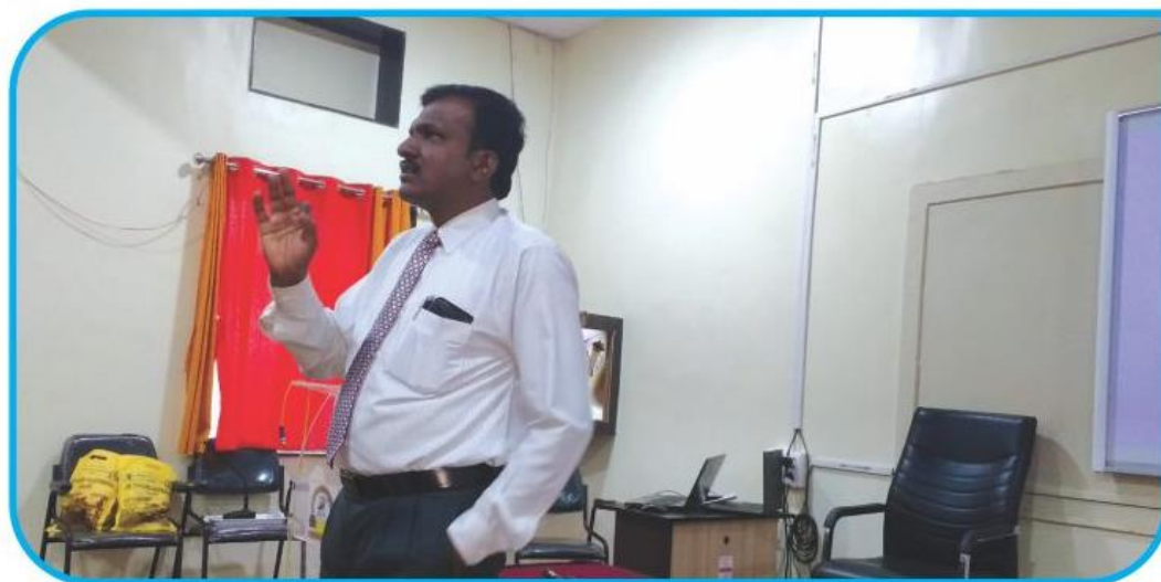
Dr. Diwate delivering lecture on Lab safety and Disaster management